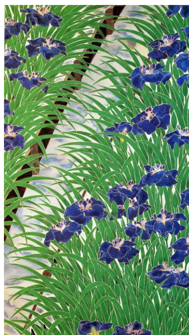
福田平八郎《花菖蒲》1934 年 京都国立近代美术馆收藏