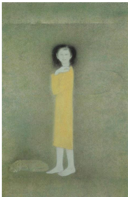
高山辰雄《少女》1979 年 个人收藏