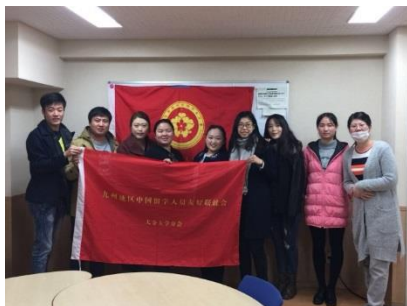
大分大学中国留学生新生欢迎会

在中日民间交流中，大分地区中国学友会以志愿者身份积极参加当地民间友好活动，为促进互信友好的中日关系发挥留学生特有作用，做出不断的努力和探索。