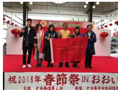
大分大学学友会参加大分春节联欢会