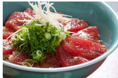
金枪鱼盖饭（ひゅうが丼）

大分县内的各种生活信息及便利消息还可以通过上网 ( http://www.oitaplaza.jp/chinese/ ) 及手机的网上免费杂志 OIPM 可了解。手机的网上杂志 OIPM 分日语、简明日语、英语、汉语 3 国语言发信。登记方法很简单，先从手机上发空邮件，然后按照返回来的邮件内容进行登记。请选择 1 种语言之后再发一次空邮件即可，免费登记。汉语：chn@oipm.jp