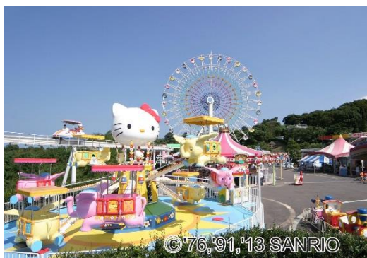
Hello Kitty Land 和谐乐园